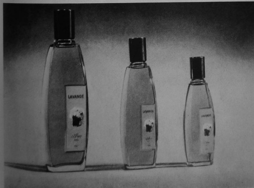
La nouvelle série de flacons L.T. Piver.

Stendhal a fêté ses dix-sept ans, le 8 avril 1963, en lançant une nouvelle gamme de produits printaniers comprenant des « solaires », deux teintes de poudres, trois coloris de rouges à lèvres, une crème antirides et un démaquilleur intégral.